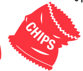
सॉफ्ट प्लास्टिक (या इसे REDcycle बनि में ले जाएँ)