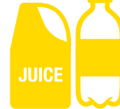
प्लास्टिक की बोटलें और डब्बे